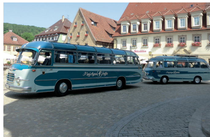
Historische Busse für die Touren im Rahmen der „Nacht der offenen Museen“ am 22. September 2018

Weitere Museumsangebote unter www.museen-im-odenwald.de