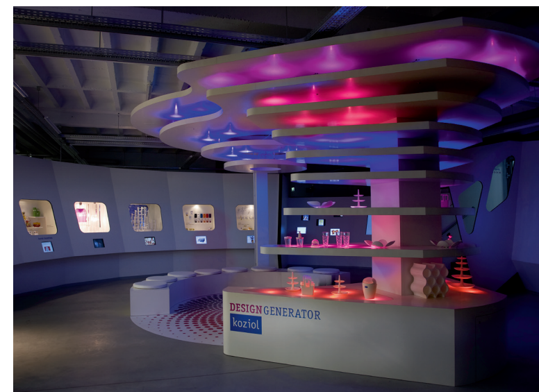
koziol-Glücksfabrik, koziol-Museum, Erbach